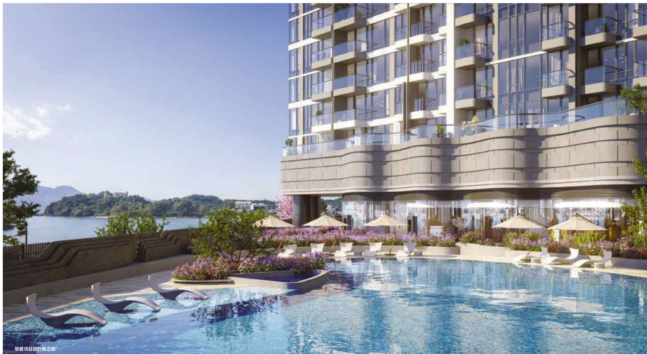
發展項目設計概念圖